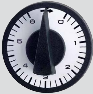
Typ 134 ..., 136.2